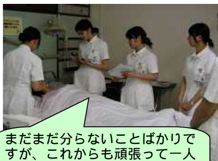
1ヶ月の集合 研修風景

4月に入職し、1ヶ月間の研修が終わりました。5月からローテーション研修で3ヶ月毎2人1組で各病棟を回ります。4月の集合研修で学んだことを活かし一生懸命頑張りますのでよろしくお願い致します。