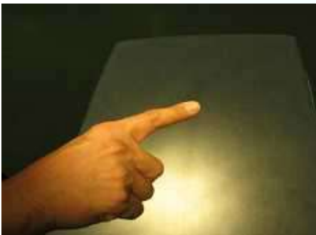
無影灯で照らした場合

突然ですが、皆さん。無影灯ってご存知でしょうか？ 見たことはあっても名前を知らない方も多いと思います。そこで今回は無影灯を紹介したいと思います。 インターネットで「無影灯」を検索すると、