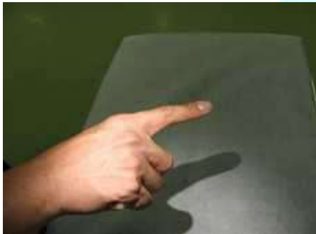
通常のライトで照らした場合