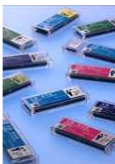
クイクセルバッジ

“クイクセルバッジ” 聞きなれない名前だと思いますが“フィルムバッジ”というと、もしかしたら少しは聞いたことのある方もいるのではないのでしょうか。