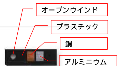
クイクセルバッジの中身

もし放射線科に来られることがあれば胸ポケットを見てみてください。実物を目にする事ができると思います。