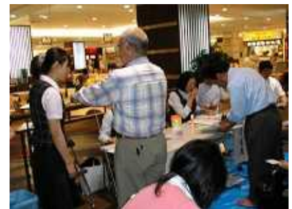
第1回無料健康フェアの様子

ベリタス病院無料健康フェアは、地域の皆様の健康の助けと、当病院での現在の取り組みを知っていただく為に昨年から行っているイベントです。簡易健康検査や医療講演会など無料で参加できますので、買物ついでや、お出かけのお帰りに是非お越しください。