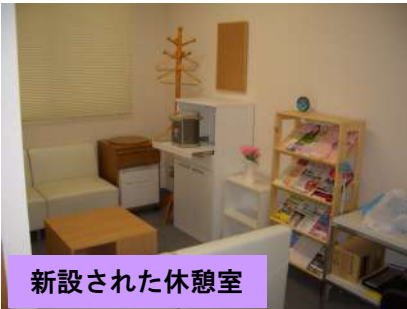
新設された休憩室