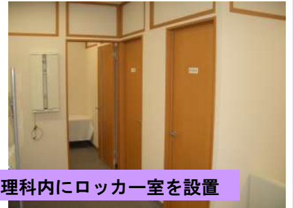
健康管理科内にロッカー室を設置

人間ドック・特定健診・市民健診・健康診断等のご要望がございましたら、是非当院の健康管理科へお問い合わせ下さい。