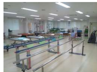
②理学療法スペース

理学療法室には現在10名の理学療法士が在籍し、整形外科や脳神経外科、循環器疾患や呼吸器疾患の患者様に対するリハビリテーションを実施しております。見渡しの良い南館へ移動した事で、周りを気にする事が少なく治療に専念して頂けるようになりました。