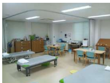
③作業療法スペース

南館への移動により、これまで4階に設置されていた作業療法室が1階へ移動した為、外来からの動線が短縮できました。そして何より作業療法部門・理学療法部門・言語聴覚部門が1ヶ所に集まった事で患者様に様々な場所へ移動していただくというご迷惑をかけずにすむようになり、患者様サービスの向上に一役果たせたと自負しております。