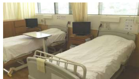
⑤リカバリールーム

また、手術件数の増加に伴い、手術後の管理を集中的に行うことで安全を確保しつつ手術件数の増加に対応できるよう、最も手術件数の多い整形外科を対象に手術後の観察を行うリカバリールームを設置いたしました。