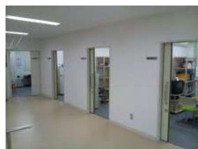
①言語聴覚療法スペース

言語聴覚部門は南館への移動に伴い、個別療法室が3室、集団療法室が1室の合計4室となり、一般成人が専門の言語聴覚士4名と小児発達障害が専門の言語聴覚士1名が業務しております。これまで2回(午後のみ)/月であった小児の発達障害の業務が2回(終日)/月に変更となった事で地域完結型医療の小児発達分野(ことばの遅れ)が当言語聴覚室でも担えるようになっております。