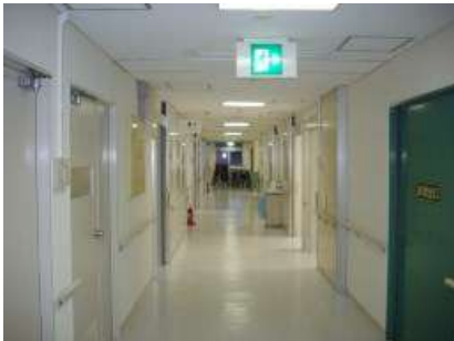
【明るくなった廊下】