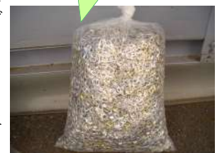
空き缶のプルタブ

日頃より、ベリタス病院のエコ活動、並びに社会貢献活動にご協力いただきありがとうございます。平成22年より実施してまいりました「ペットボトルのキャップをワクチンへ」「空き缶のプルタブを車椅子へ」活動につきまして、これまでに約650本分のワクチンを寄付することができました。この度当院では、この活動が一定の成果を上げられたと判断させていただき、平成26年10月末をもちましてペットボトルのキャップ、空き缶のプルタブ回収活動を終了させていただくことになりました。長年に渡り、回収にご協力いただきありがとうございました。今後につきましては、新たなエコ活動、並びに社会貢献活動を検討していきたいと考えております。