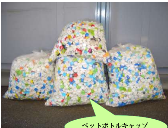
ペットボトルキャップ

日頃より、ベリタス病院のエコ活動、並びに社会貢献活動にご協力いただきありがとうございます。平成22年より実施してまいりました「ペットボトルのキャップをワクチンへ」「空き缶のプルタブを車椅子へ」活動につきまして、これまでに約650本分のワクチンを寄付することができました。この度当院では、この活動が一定の成果を上げられたと判断させていただき、平成26年10月末をもちましてペットボトルのキャップ、空き缶のプルタブ回収活動を終了させていただくことになりました。長年に渡り、回収にご協力いただきありがとうございました。今後につきましては、新たなエコ活動、並びに社会貢献活動を検討していきたいと考えております。