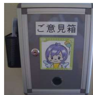
業務改善・サービス向上委員会