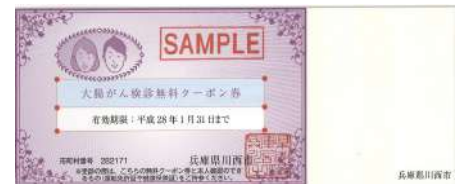
無料クーポンサンプル

ベリタス病院では、川西市・猪名川町から指定を受けた下記項目及び川西市が本年度より開始した肝炎ウイルスの無料検診をご受診いただけます。ご自身の元へ届いた検診案内をご確認いただきご不明点などは各市町村にお問い合わせください。