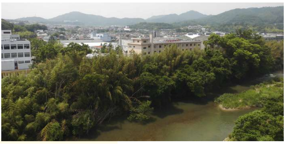
病院屋上からの風景

《基本理念》 真心のこもった良質な医療を通して地域社会に貢献します 《基本方針》 1.安全で安心な医療を提供します 2.優秀な医療技術の向上に努めチーム医療を推進します 3.快適な医療環境を提供します 4.全職員が誇りをもって働ける環境をつくります 5.安定した経営を維持し地域と職員に還元します