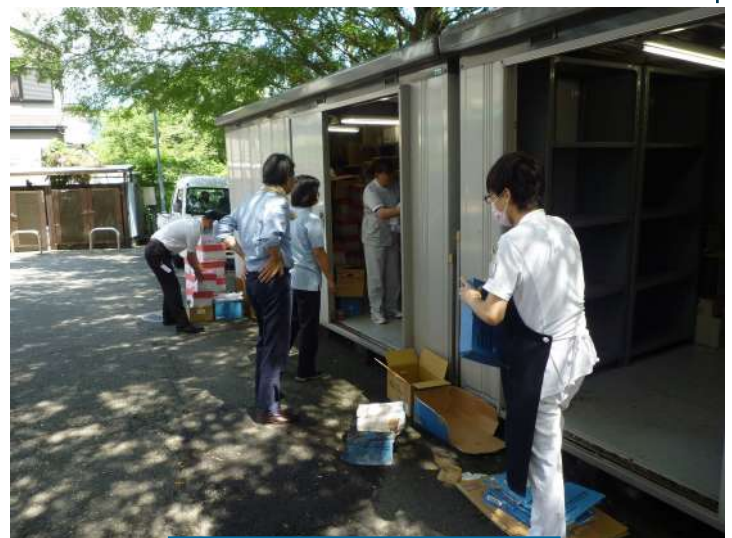
2 S 活動での倉庫の整理風景

このように徹底して整理整頓をすることにより、仕事の効率化やミスを減らすことができるといわれています。どの職場においても大切なことですが、特に医療現場では医療安全を高める効果が期待されています。