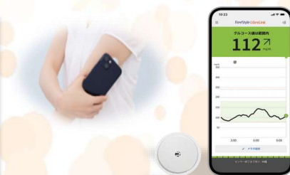
スマートフォンを利用した 測定イメージ

これにより、インスリン注射が必要なタイミングや糖分摂取のタイミングが分かりやすくなります。