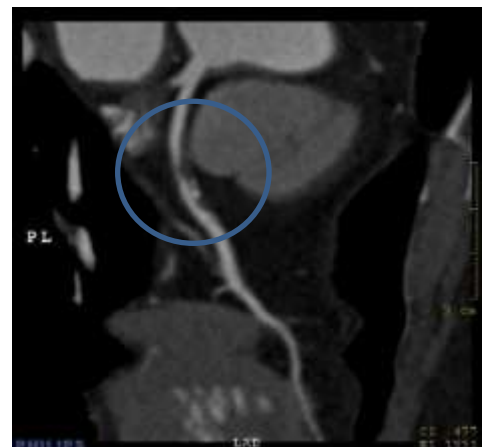
○の中の血管が狭窄部位