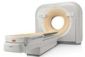
Ingenuity Core64 オランダ・PHILIPS社製

心臓ドックでは、造影剤を注射して10秒程度の息止めをするだけで、心電図からの情報を用いて狭心症や心筋梗塞の原因となる心臓の冠動脈の狭窄や閉塞を明瞭な三次元画像として描出することが出来ます。